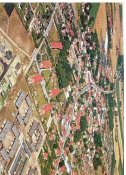
Flygbild färg 1973