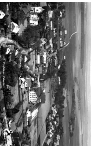
ca 1935