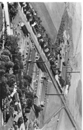
1955 Tegelbrukets foto Stockholms Aero från Roland Jönssons samling